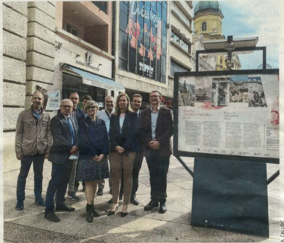
Izložba na Korzu odaje počast liječnicima koji su napravili pionirski posao u Rijeci, ali pokazuje i rezultate transplantacijskog programa

Ova izložba za mene je i emocionalna jer je usadena duboko u život moje obitelji, no prvenstveno, ona je i samo jedna od naznaka koliko je Rijeka bila ukorak s trendovima u medicini, rekao je prilikom otvorenja Palčevski, podsjetivši, između ostalog, da je